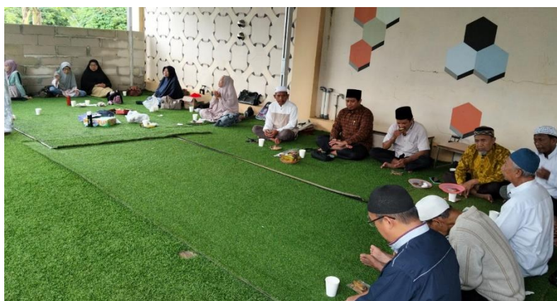
Gambar 2. Pelaksanaan Kegiatan Pengajian

Melalui kajian yang berkesinambungan, jamaah diarahkan untuk memperbaiki kualitas bacaan, meningkatkan konsistensi muraja'ah, dan menumbuhkan adab belajar yang lebih disiplin. Nilai Qur'ani tidak dipahami sebagai konsep abstrak, melainkan hadir sebagai nilai yang hidup dan membentuk pola perilaku jamaah, seperti kesantunan saat menyimak, kesabaran saat dikoreksi, dan tanggung jawab menjaga hafalan di rumah. Analisis proses pembelajaran menunjukkan adanya peningkatan kerapian belajar peserta, terutama ketika forum tidak hanya memberi materi, tetapi juga menyediakan waktu praktik, koreksi, dan peneguhan kebiasaan muraja'ah dalam rutinitas harian.