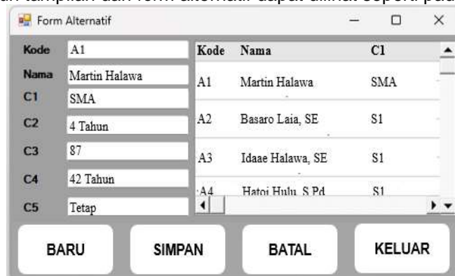
Gambar 3. Tampilan Form Alternatif

Tampilan form alternatif digunakan user untuk memasukkan data alternatif dan disimpan ke dalam database . Adapun tampilan dari form alternatif dapat dilihat seperti pada gambar di bawah ini.