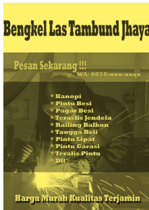
Gambar 2. Dokumentasi Hasil Pembuatan Brosur Informatif Sebagai Media Promosi Usaha Bengkel Las dengan Aplikasi Photoshop