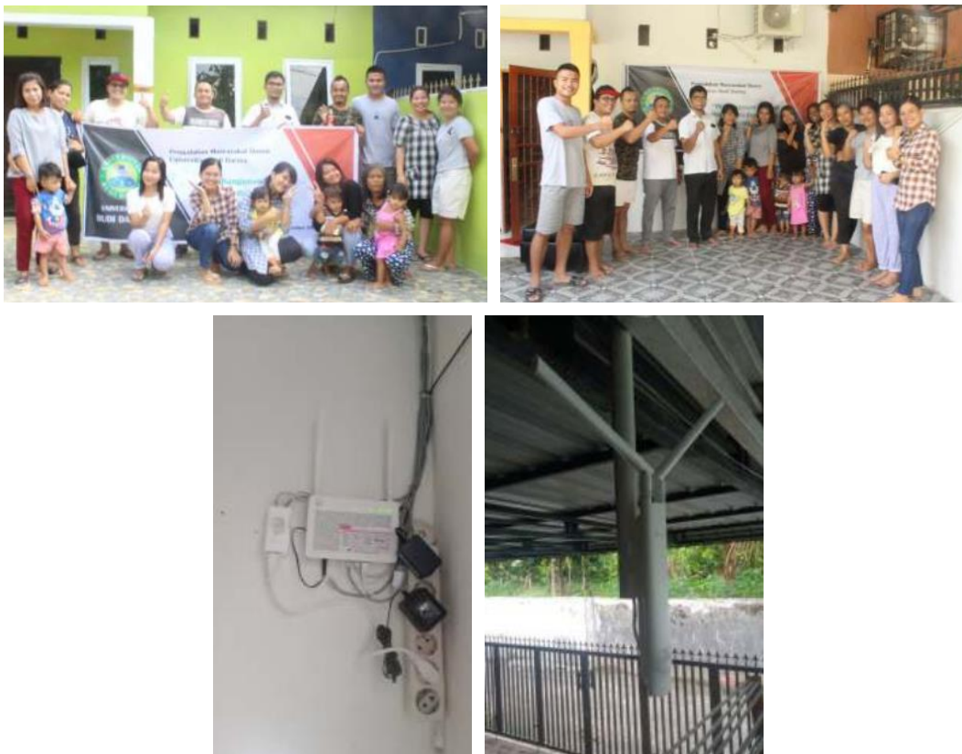
Gambar 2. Dokumen Kegiatan