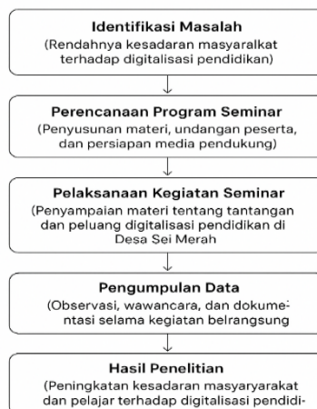
Gambar 1. Diagram Alur Penelitian

Diagram alur di bawah menggambarkan langkah-langkah dalam studi berjudul “Meningkatkan Kesadaran akan Tantangan dan Peluang Digitalisasi dalam Pendidikan melalui Seminar di Desa Sei Merah” Studi ini dimulai dengan penentuan masalah, yaitu kurangnya kesadaran masyarakat mengenai pentingnya digitalisasi di sektor pendidikan. Setelah masalah teridentifikasi, langkah berikutnya adalah merencanakan seminar yang meliputi penyusunan konten, pemilihan peserta, dan persiapan alat bantu agar acara dapat berjalan dengan baik. Langkah selanjutnya adalah penyelenggaraan seminar, di mana informasi mengenai tantangan dan peluang dalam digitalisasi pendidikan disampaikan kepada warga Desa Sei Merah melalui kegiatan interaktif dan diskusi kelompok. Setelah seminar dilaksanakan, peneliti mengumpulkan data melalui observasi, wawancara, dan dokumentasi untuk mendapatkan informasi terkait perubahan kesadaran masyarakat.