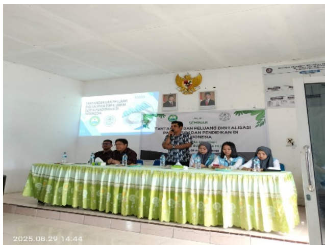
Gambar 2. Kata Sambutan Dari Kepala Desa

Dari hasil pelaksanaan kegiatan berikut beberapa foto yang digunakan sebagai dokumen pelaporan keterlaksanaan kegiatan pengabdian kepada masyarakat.