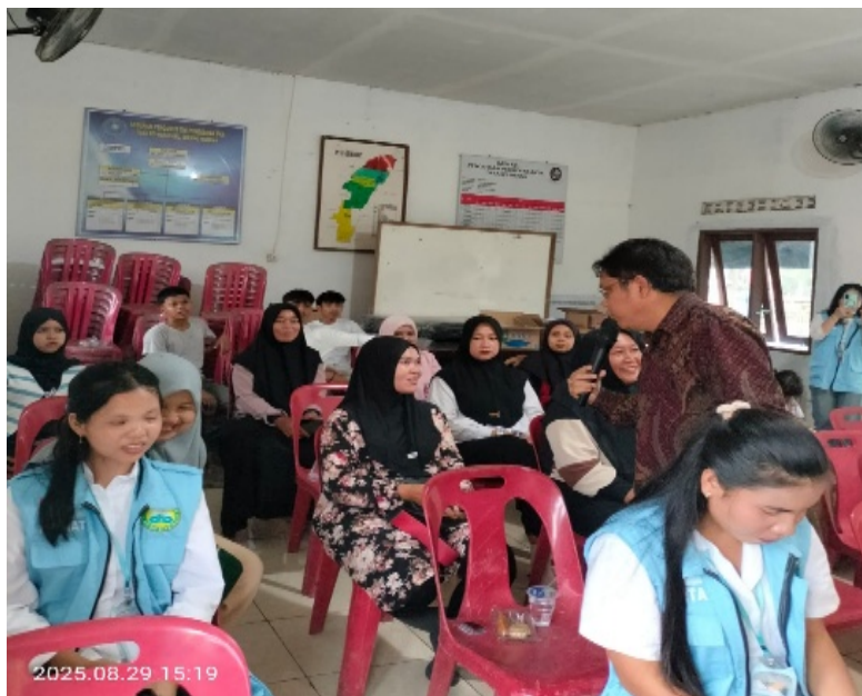
Gambar 4. Sesi Tanya Jawab

Gambar 3 menunjukkan pemateri kedua yang membahas tantangan dan peluang digitalisasi pendidikan serta cara masyarakat dapat memanfaatkan teknologi untuk mendukung proses belajar.