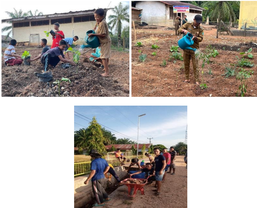
Gambar 1. Menanam sayur di perkebunan remaja