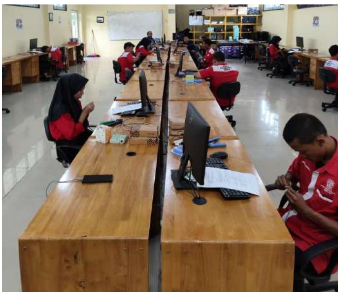
Gambar 4. Siswa Sedang Mengikuti Ujian Mikrotik

Foto menunjukkan tim pengabdian kepada masyarakat sedang memberikan penjelasan terkait tata tertib, alur pelaksanaan, serta teknis ujian Mikrotik kepada siswa SMKS MUHAMMADIYAH 9 di laboratorium jaringan komputer. Kegiatan ini bertujuan untuk memastikan peserta memahami mekanisme ujian, skenario konfigurasi jaringan, serta aturan yang harus dipatuhi selama ujian berlangsung agar pelaksanaan ujian berjalan tertib, objektif, dan sesuai standar kompetensi.