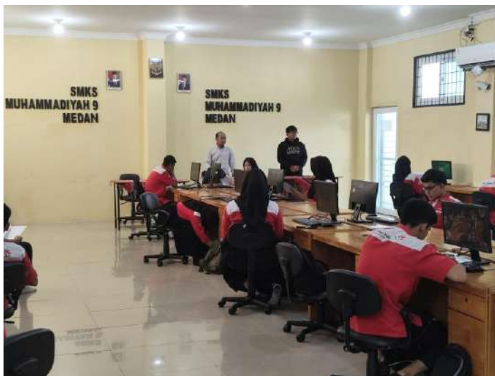
Gambar 3. Penjelasan Pelaksanaan Ujian Mikrotik

bahwa kegiatan dilaksanakan secara tertib, terstruktur, dan sesuai dengan metode pelaksanaan yang telah direncanakan.