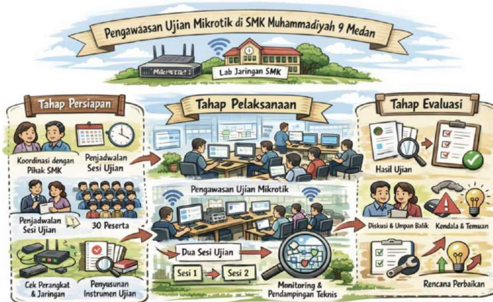
Gambar 2. Tahapan Pelaksanaan PKM

Kegiatan Pengabdian kepada Masyarakat ini dilaksanakan di Sekolah Menengah Kejuruan (SMK) Swasta Muhammadiyah 9 Medan yang memiliki kompetensi keahlian di bidang Teknik Komputer dan Jaringan (TKJ). Lokasi kegiatan berada di laboratorium jaringan komputer SMK, yang telah dilengkapi dengan perangkat komputer, router Mikrotik, serta infrastruktur jaringan pendukung. Pemilihan lokasi didasarkan pada kebutuhan sekolah terhadap pendampingan dan pengawasan ujian Mikrotik serta kesiapan sarana dan prasarana yang tersedia.